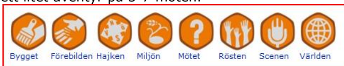
Deltagarmärken för äventyrare

För äventyrarscouterna finns åtta deltagandemärke, alla frivilliga. Blå Tråd kommittén vill dock uppmuntra engagemang i märkena Förebilden och Hajken . Ett märke ska omfatta ett litet äventyr på 3-7 möten.